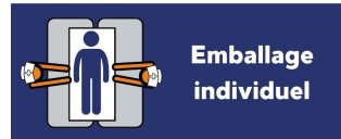
Drap jetable 60 gr de transfert - Carton de 50 - 150x220 cm